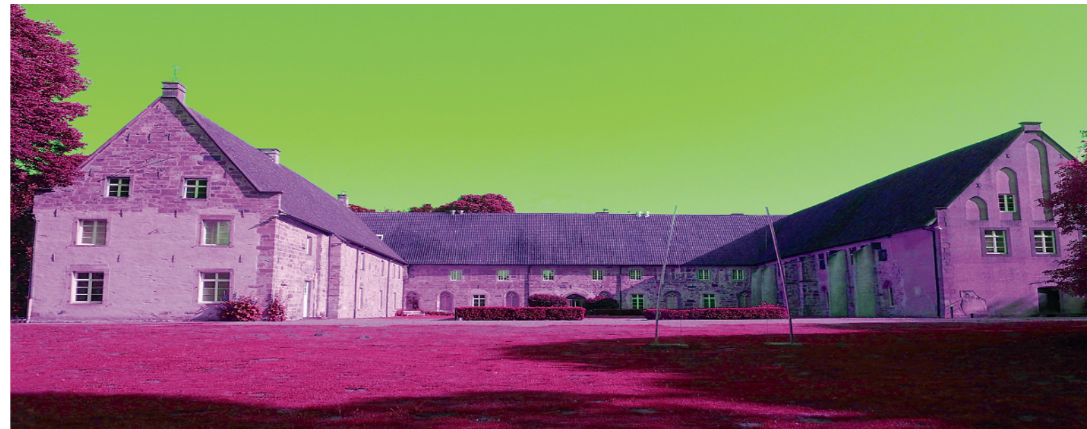
Graphik Design: www.herkerwerke.de

ALTES STROH ZU NEUEM GOLD KunstOrt MünsterLand | 2016